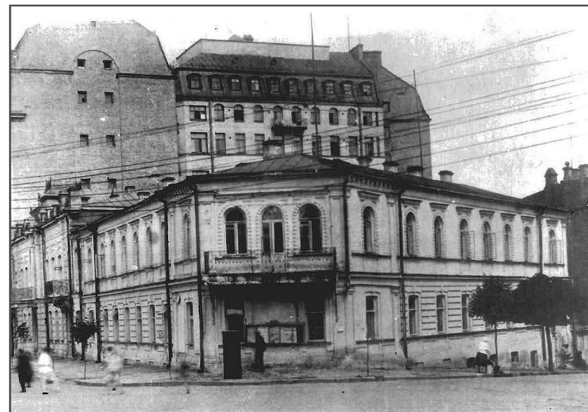
Будівля Гідрометслужби України на вул. Короленка, 21 (зараз — вул. Володимирська). Київ, 1935 р.