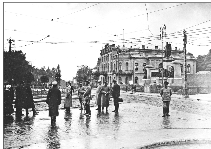
Царська (нині – Європейська) площа в Києві, вид на будинок Купецьких зборів, де розташовувалося керівництво Всеукраїнського союзу георгіївських кавалерів. Осінь 1918 р. Фото з приватної колекції.