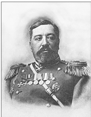
Генерал Георгій Ступін – голова Георгіївської думи Української Держави. Фото з «Летописи русско-японской войны».

15 листопада 1918 р. в Україні почалося антигетьманське повстання. Очолювана колишніми лідерами Центральної Ради Директорія залучила на свій бік частину збройних сил Української Держави та велику кількість повстанців. На початку грудня П. Скоропадський вирішив ушанувати георгіївськими нагородами тих, хто брав участь у боях на його стороні. Георгіївську думу очолив головнокомандувач усіх збройних сил, що діяли на території України, генерал-лейтенант князь О. Долгоруков, який обіймав цю посаду з 26 листопада 1918 р. 9 Гетьман