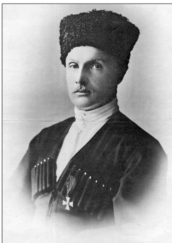
Гетьман Павло Скоропадський з орденом Святого Георгія 4-го ступеня.

Генерал П. Скоропадський, ставши гетьманом, негайно засудив усі декрети більшовицького уряду. Серед іншого, наказом Військової офіції Української Держави № 221 від 16 червня 1918 р. було повернуто