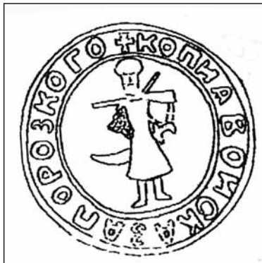
Військова печатка Війська Запорозького, 1603 р. Реконструкція І.Ситого з відбитка печатки на листі (універсалі) гетьмана Г.Крутневича ченцям київського Микільсько-Пустинського монастиря від 22.V. (1.VI) 1603 р., що зберігається у Чернігівському історичному музеї ім. В.В.Тарновського (Ситий І. Сфрагістичні дослідження Олександра Лазаревського // Знак. – Число 9 (лютий 1995 р.). – С.3)