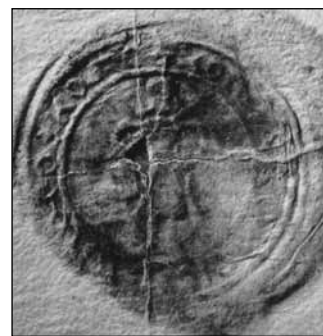
Відбиток військової печатки на військово-му листі (універсалі) гетьмана Г.Крутневича ченцям київського Микільсько-Пустинського монастиря, 22.V. (1.VI) 1603 р. (Кардаш П., Кот С. Слава українського козацтва. – Мельбурн; К., 1999. – С.94)