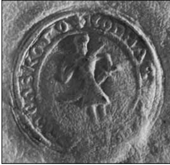
Відбиток військової печатки на листі запорозького гетьмана Г.Крутневича до великого коронного гетьмана Я.Замойського, 9.XI.1600 р. // Archiwum Główne Akt Dawnych. – Archiwum Zamojskich. – Rkps. №153. – S.6)