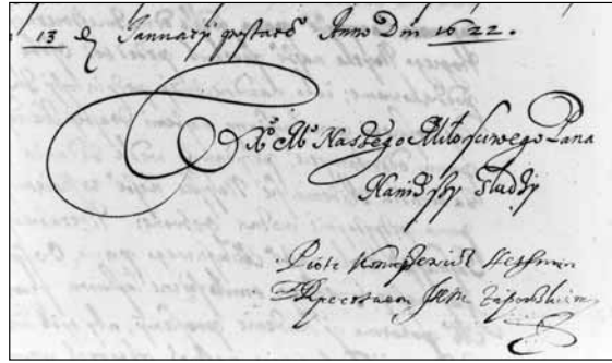
Автограф гетьмана П.Сагайдачного, 1622 р. (П.Сагайдачний до К.Радзивілла, 13(23).I.1622 р. // Archiwum Główne Akt Dawnych. – Archiwum Radziwiłłow. – Dz.II. – Rkps. №804. – S.2)