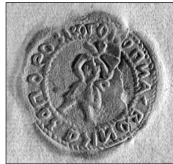
Відбиток військової печатки на листі гетьмана А.Гавриловича до коронного підканцлера Т.Замойського, 4.IX.1632 р. (Archiwum Główne Akt Dawnych. – Archiwum Zamojskich. – Rkps. №306. – S.13)