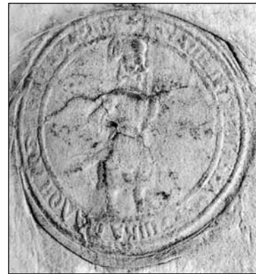
Відбиток військової печатки на універсалі гетьмана Б.Хмельницького, 2.II.1656 р. (Україна – козацька держава: Ілюстрована історія українського козацтва у 5175 фотосвітлинах. – К., 2004. – С.517)