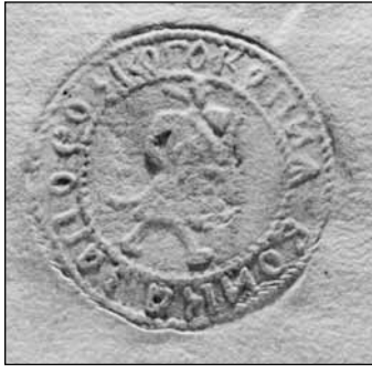
Відбиток військової печатки на листі запорозького гетьмана П.Сагайдачного до литовського польного гетьмана К.Радзивілла, 13(23).I.1622 р. (Archiwum Główne Akt Dawnych. – Archiwum Radziwiłłow. – Dz.II. – Rkps. №804. – S.3)