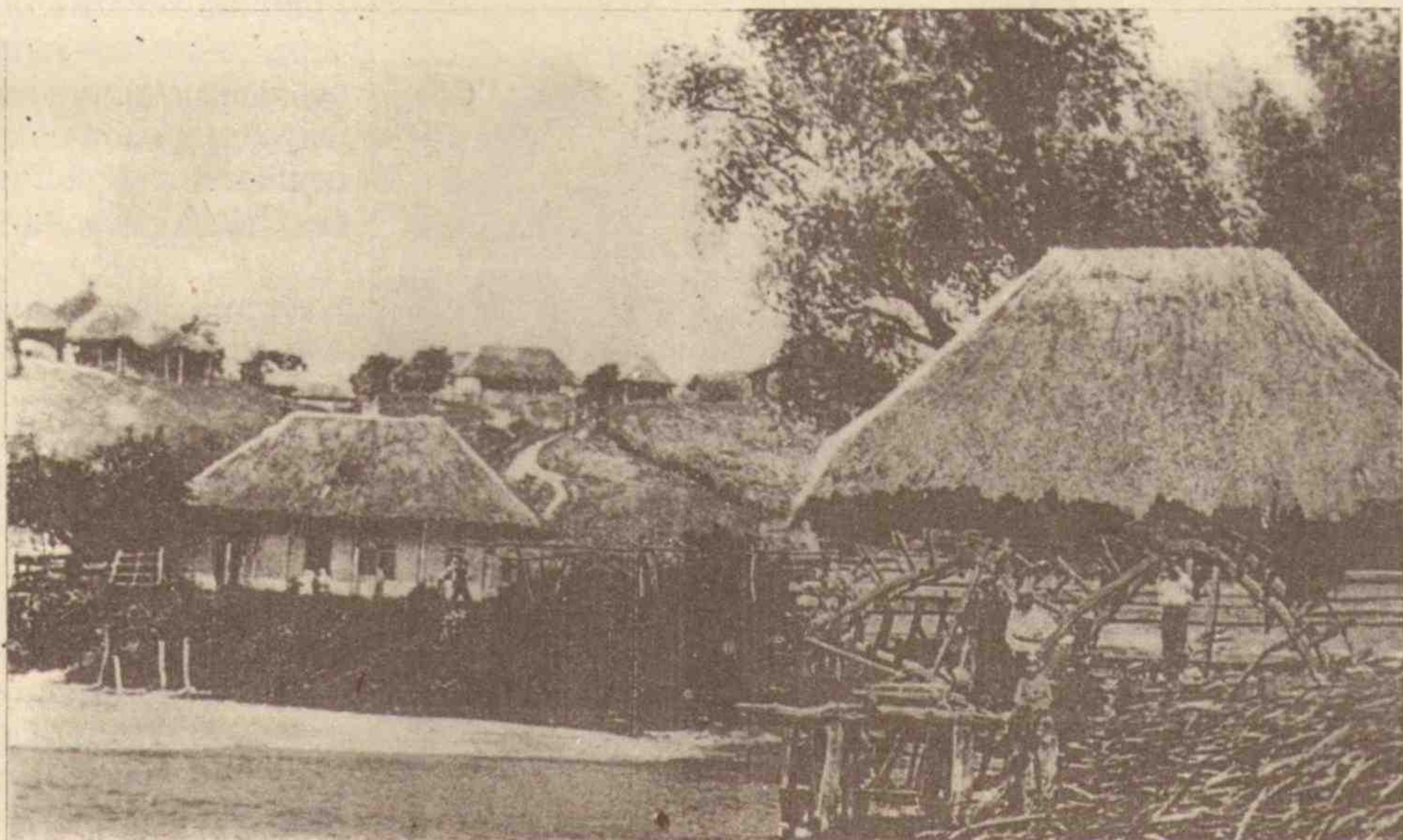
Вигляд одного із сіл Харківської губернії. Початок ХХ ст.