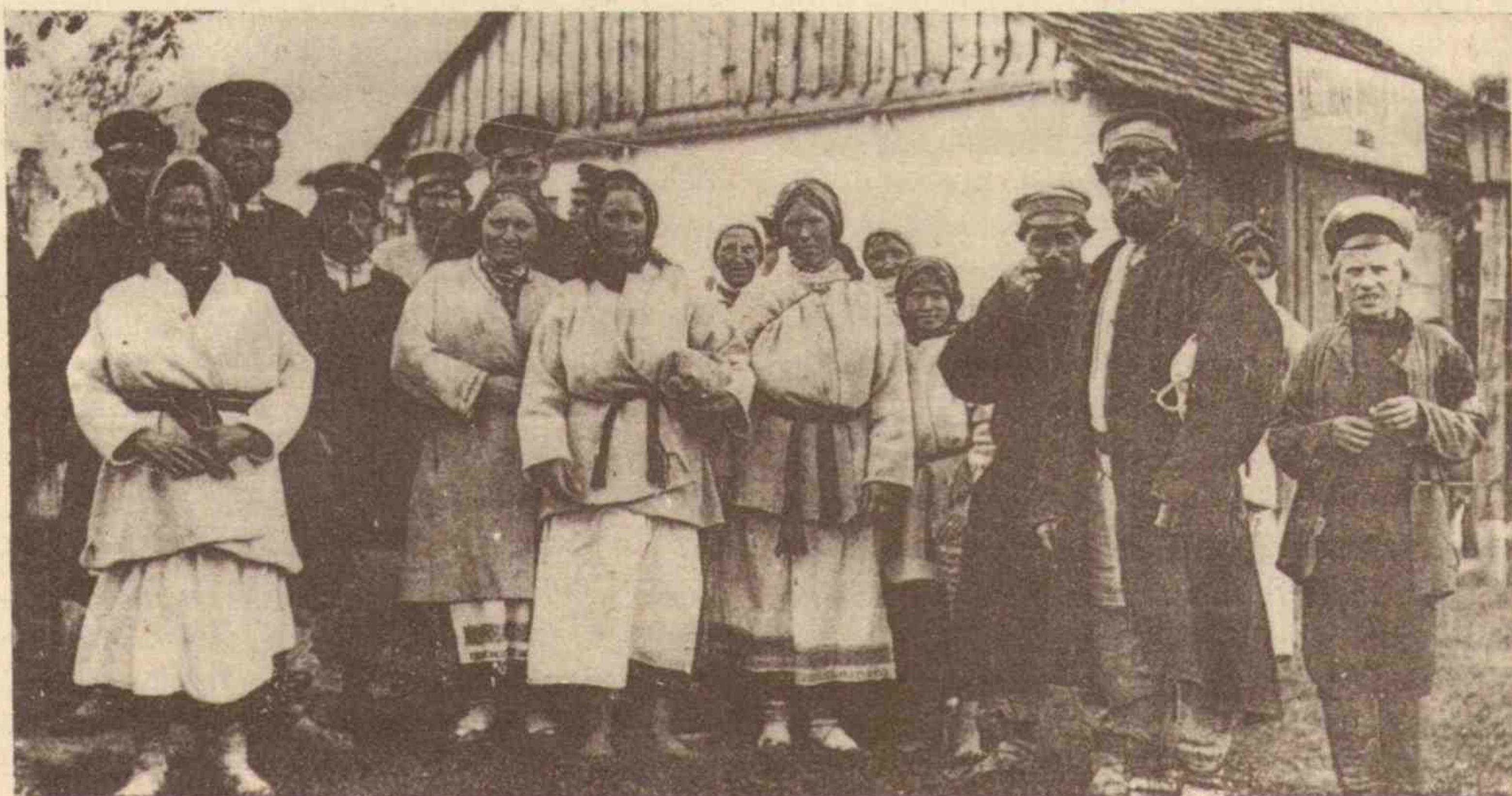
Селяни-поліщуки в м. Сороки Волинської губернії. 1916 р.