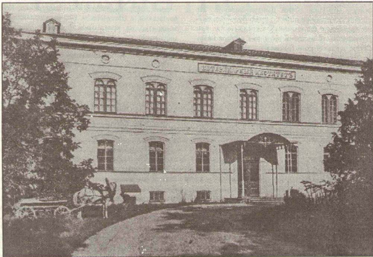
Тут, у будинку колишнього Ветеринарного інституту (архїт. М.Львов), відбулася I Всеукраїнська краєзнавча конференція.

Як безпосередньо причетний до цієї роботи, хочу відзначити, що вона стала можливою лише після підготовки як зразка для інших регіо-