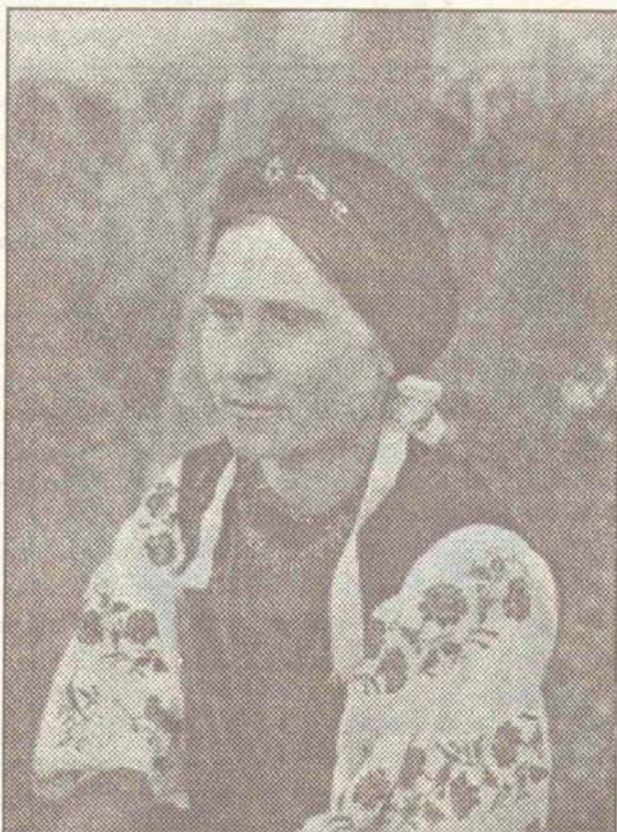
Молодиця з села під Харковом. Світлина з часопису «Ілюстрована Україна», ч. 3 за 1914 р.