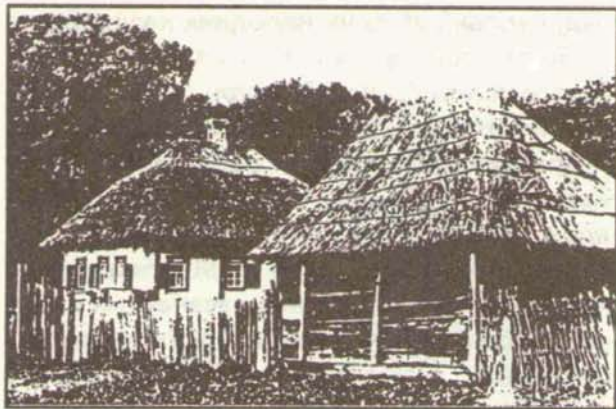
Українська хата в с. Озерянім Харківського району. (З давньої гравюри).

співавторстві з Дмитром Міллером, талановитим істориком, автором фундаментальних досліджень з історії юридичних звичаїв в Україні), «Очерки по русской истории. Т. 2. Монографии и статьи по истории Слободской Украины» , двотомний «Опыт истории Харьковского университета (по неизданным материалам)» та інші праці, цілий інститут повинен був би працювати протягом кількох десятиліть.