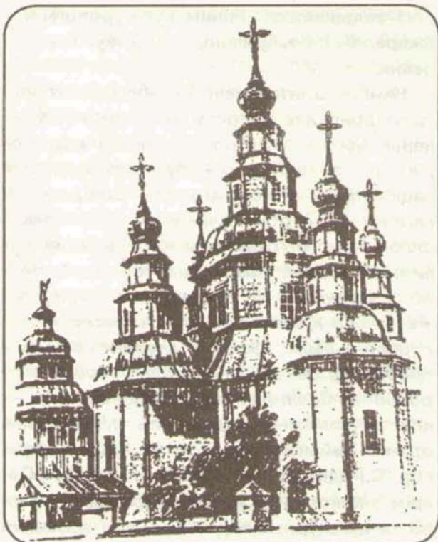
Старовинний козацький храм у селі Артемівці Харківського району. (З давньої гравюри).