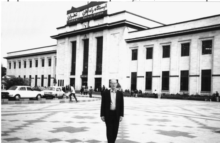
Тегеран, Ісламська Республіка Іран. Біла будівлі Тегеранського залізничного вокзалу. 2005 р. Публікується вперше.