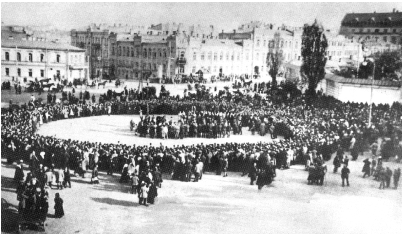
Молебен на Софійському майдані після проголошення П. Скоропадського гетьманом України

йшли у земельний фонд, що розподілявся серед неімущих категорій селян. При цьому скасовувалася приватна власність на землю, яка виводилася зі сфери товарно-грошових відносин. Остання оголошувалася загально-народною власністю. Німецько-австрійська присутність спричинила до нової хвилі невдоволення селян. Свавільні реквізиції збіжжя провокували конфлікти з останніми. Ситуацію ускладнили добровольчі каральні загони, які, прагнучи повернути поміщицькі землі, передані селянам у користування, вдавалися до прямих розправ з ними. Зіткнення на селі набували форми громадянської війни, і до кінця ліквідувати причини, що їх породжували, гетьманському уряду так й не вдалося. Втім, це не означає, що він не надавав цій проблемі достатньої уваги.