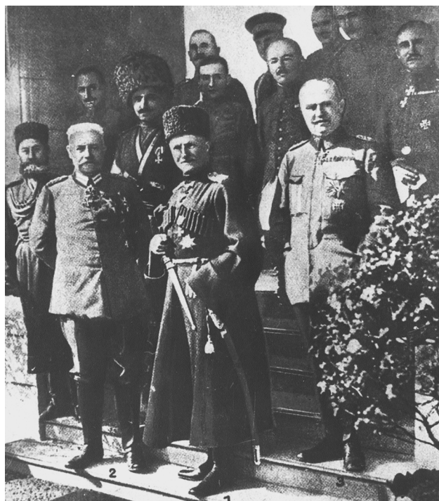
Скоропадський, Гінденбург, Людендорф й інші в німецькій головній квартирі. 1918 р.

Прагнучи, щоб українська театральна й музична культура вийшла на європейський рівень, П.Скоропадський особисто опікувався творчими колективами, які могли знайомити українську публіку з кращими зразками світового мистецтва. В травні уряд виділив 165 тис. крб. Товариству «Національний театр», ініціатором створення якого були трупа М.Садовського, «Молодий театр» Л.Курбаса і Музично-драматична школа ім. М.Лисенка. В серпні було створено Державний драматичний театр, творчий колектив якого склали відомі російські та українські актори й режисери. У жовтні на базі Національного зразкового театру, за рішенням уряду почав діяти Державний народний театр під керівництвом П.Саксаганського, в якому працювали М.Заньковецька Г.Затиркевич-Карпинська, І.Замичковський та інші видатні митці.