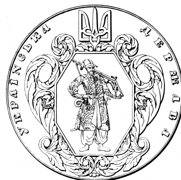
Велика печатка Української Держави