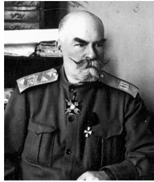
Міністр військових справ О. Рогоза

До давнього українського роду належав й міністр військових справ Олександр Рогоза – генерал-лейтенант Генерального штабу, командувач армією. Він не вирізнявся „українством”,