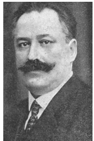
Міністр закордонних справ Д. Дорошенко