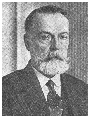
Голова Ради Міністрів Ф. Лизогуб

П.Скоропадський розпустив Центральну і Малу Ради, земельні комітети, звільнив з посад міністрів і більшість їх заступників. Реалізувати соціально-економічні реформи, а також проводити помірковану політику у культурно-освітній сфері мав новий правлячий клас. Гетьман отримав виключне право затвердження провідних посадовців владної вертикалі від прем'єра, міністрів, сенаторів до глав місцевих адміністрацій – старост. Ставлячи на перше місце ділову репутацію, адміністративний досвід, Гетьман мав враховувати й ступінь «українськості» вищого кадрового ешелону держави. Її основними критеріями виступали українське (малоросійське) етнічне походження та минула праця, територіально пов'язана з Україною.