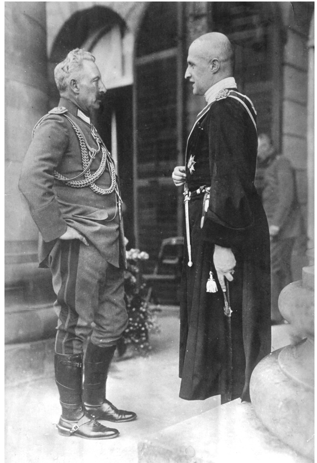
Кайзер Вільгельм II та гетьман П. Скоропадський

Прикладом такої трансформації свідомості був й сам П. Скоропадський як людина двох культур – української та російської. З першою його пов'язувало родове походження, виховання і сімейні традиції. З другого – блискуча військова кар'єра, належність до царської аристократії. Після падіння імперії, революціонізації армії, він не без внутрішнього спротиву береться за українізацію свого корпусу, йде на співпрацю з Центральною Радою, але залишається для її керманівців «класово чужим». І врешті стає на шлях її повалення. Як бачимо, Павло Скоропадський – представник одного з