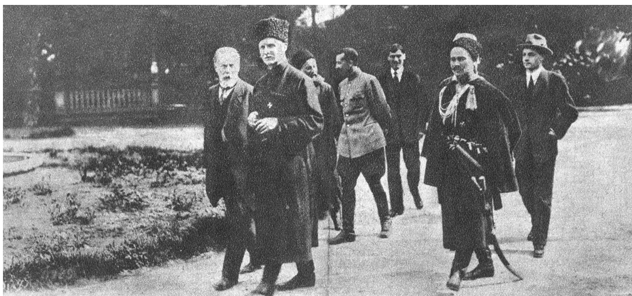
Гетьман П. Скоропадський зі своїм оточенням

Задекларована в цих актах консервативно-ліберальна ідеологія державного будівництва значною мірою увібрала в себе положення програми, створеної П. Скоропадським навесні 1918 р. політичної організації «Українська народна громада». Саме з неї були перенесені до