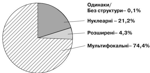
Рис. 2. Співвідношення сімей козаків Лубенського полку за типами

Сума розширених і мультифокальних домогосподарств становить загальну групу складних сімей, частка яких у середовищі козаків складала 78,7%, тобто переважну більшість (див. рис. 2).