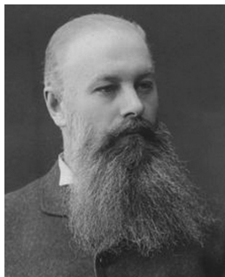
В.В. Докучаєв – керівник Полтавської експедиції

на біологічному факторі ґрунтоутворення, на ролі в цьому процесі живої речовини та продуктів її життєдіяльності. Потрібно відзначити й те, що всі зібрані на Полтавщині матеріали лягли в основу низки наукових праць В.І. Вернадського, присвячених ґрунто-геологічному