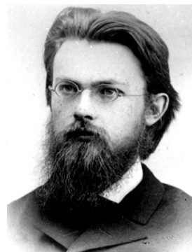
Так виглядав В.І. Вернадський, коли почав працювати у Полтавській експедиції В.В. Докучаєва

Не менш цікавою була творча співпраця В.І. Вернадського зі знаменитою Полтавською сільськогосподарською дослідною станцією. Вперше він побував тут на прохання В.В. Докучаєва ще восени 1890 року для з'ясування потужності та хімізму ґрунтів. Згодом Володимир Іванович був тут у 1916 та 1918 рр. Тоді він оз-