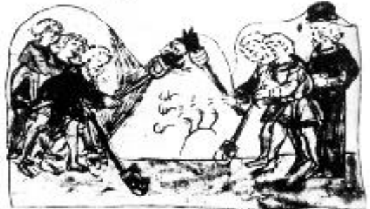
Мал. 2. Копують могилу Тугорканові на Берестовім . Малюнок XIII (XV) ст.

порутима . маду шн макерстове ад рогн пдоуци ма жана мастарь