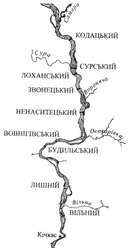
Рис. 2. Схема дніпрових порогів

Загалом, пороги тягнулися майже на сімдесят кілометрів і становили реальну загрозу для судноплавства. «За точними вимірами, увесь порожистий простір Дніпра, в запорізьких теренах, займає шістдесят п'ять