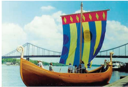
Рис. 4. Судно «Княгиня Ольга»

У 2000–2001 рр. в Україні була проведена міжнародна експедиція на судні «Княгиня Ольга» за участю вітчизняних та закордонних дослідників. Ця експедиція мала на меті змодельовати історичний процес і повторити перехід «із Варягів у Греки» тисячолітньої давнини. У 2000 р. човен пройшов маршрутом Київ–Переяслав–Хмельницький–Черкаси–Кременчук–Дніпропетровськ–Запоріжжя–Херсон–Одеса–Очаків–Стамбул, а потім повернувся до Херсона. У Стамбулі він пришвартувався 15 вересня 2000 р., подолавши за 85 днів 2714 кілометрів.