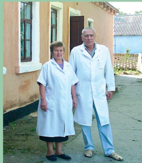
Дільнична лікарня, збудована на поч. XX ст.