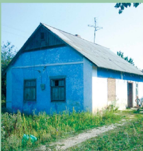
У таких будинках жили переселенці з Устяного.