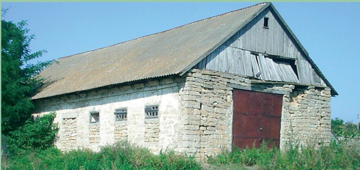
Колишній сільський театр, збудований наприкінці XIX ст.