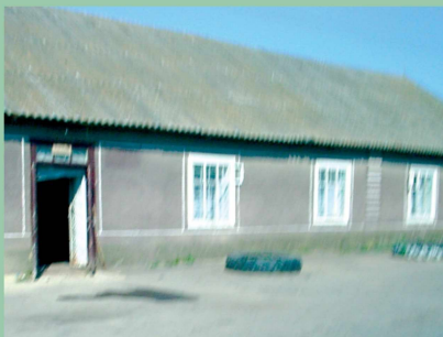
Старий сільський клуб (повоєнна будова).