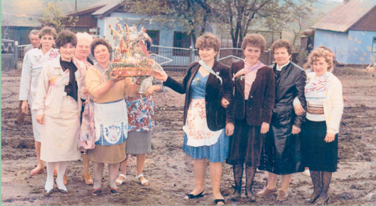
Весілля. Маринівські свашки.