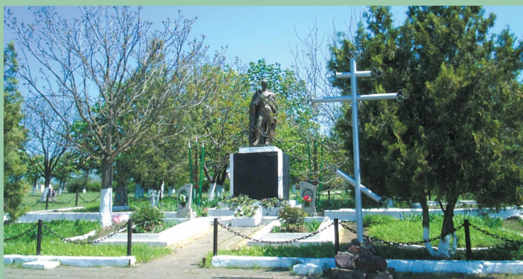
Пам'ятник полеглим за визволення Маринового.