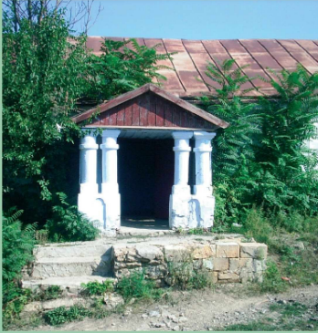
Сільська школа, збудована німецькими колоністами на початку XX ст.