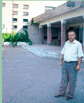
Нова школа, збудована в 1988 році.