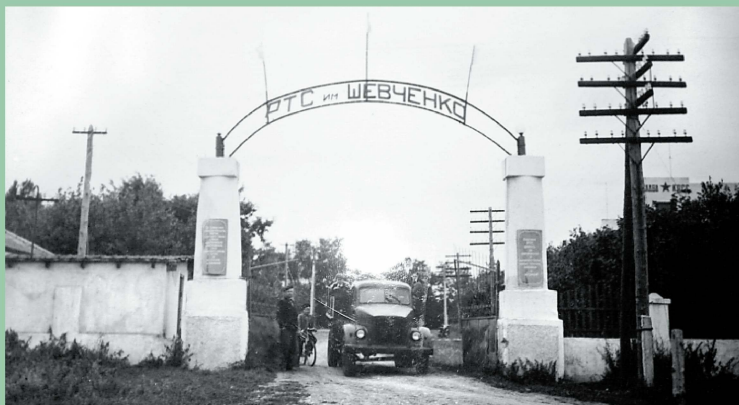
Ворота РТС ім. Шевченка. Тут свого часу працювало 60 відсотків маринівців.