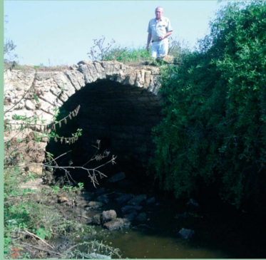
Кам'яний міст через потічок (поч. XX ст.).