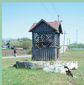
Центральна криниця села.