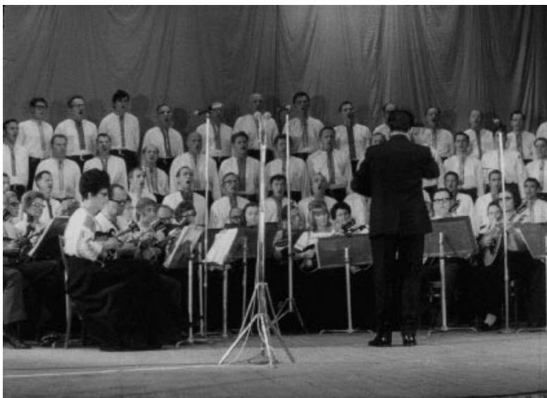
Виступ хору Танцювально- хорового ансамблю ім. Т. Г. Шевченка Товариства об'єднаних українських канадців з м. Торонто в с. Кошманівка. Машівський р-н Полтавської обл., 1970 р.