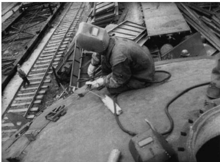
Монтаж найпотужнішої у світі домни № 8 на Криворізькому металургійному заводі ім. В. І. Леніна. м. Кривий Ріг Дніпропетровської обл., 1967 р.