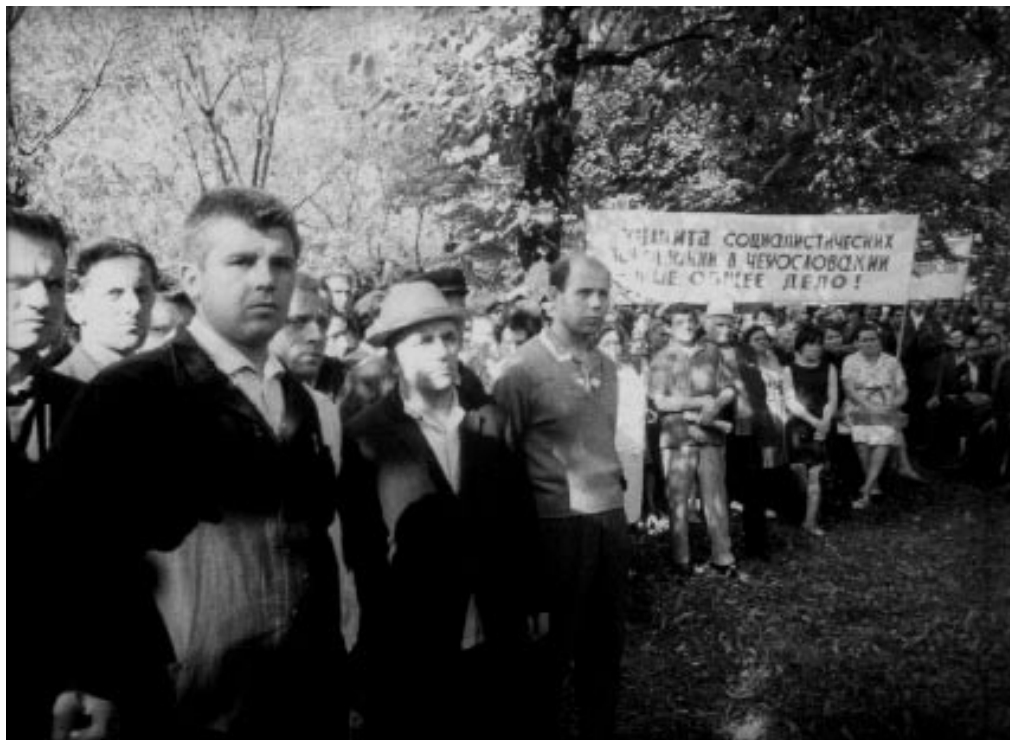
Мітинг у зв'язку з політичними подіями у Чехословаччині на Київському заводі верстатів-автоматів ім. Максима Горького. м. Київ, 1968 р.