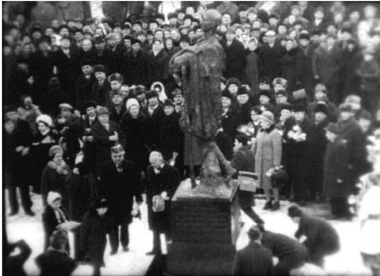
Мітинг з нагоди відкриття пам'ятника українському філософу Г. С. Сковороді в м. Переяславі- Хмельницькому. Київська обл., 1972 р.