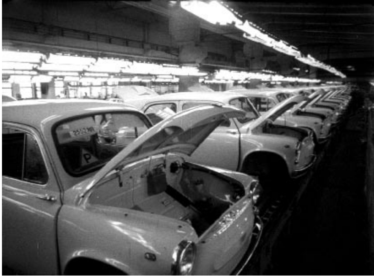
Нові моделі легкового автомобіля "Запорожець-966-В" на конвеєрі Запорізького автомобільного заводу "Комунар". м. Запоріжжя, 1968 р.