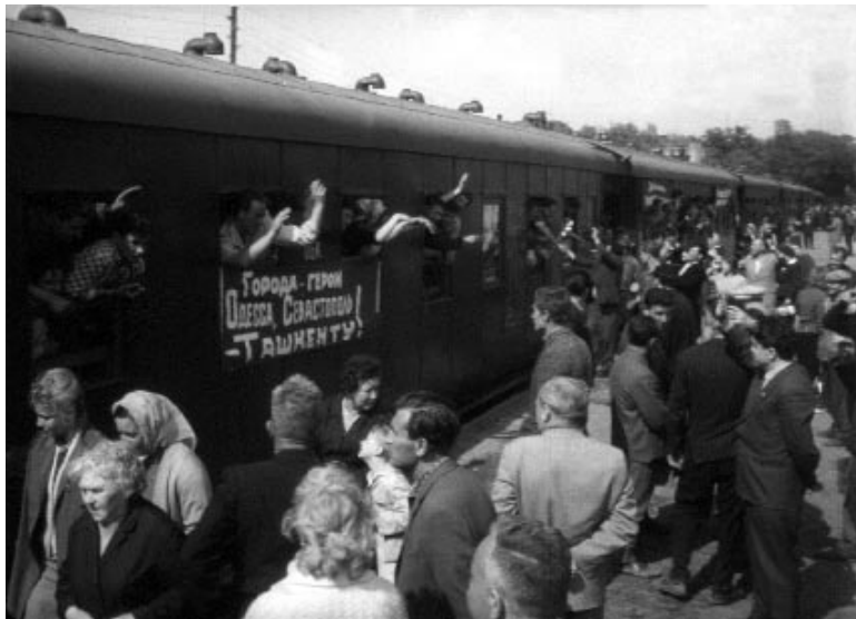
Відправлення людей з міст Києва, Одеси, Харкова в Ташкент для надання допомоги населенню, яке постраждало від землетрусу. м. Київ, 1966 р.