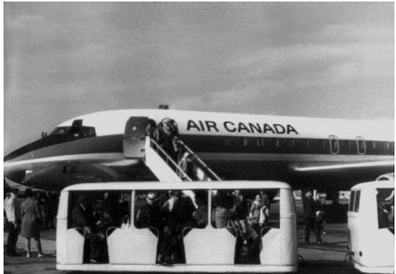
Прибуття першого літака нової міжнародної авіалінії Київ- Монреаль (Канада) в Бориспільський аеропорт. Київська обл., 1970 р.