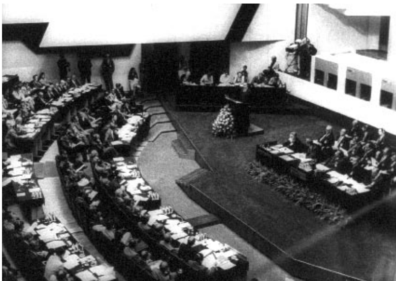
Зал засідань Наради з безпеки і співробітництва в Європі. м. Хельсінкі, (Фінляндія), 1975 р.