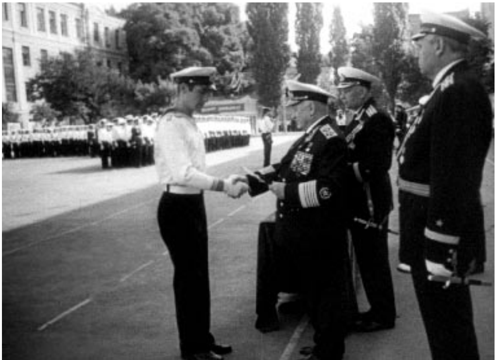
Вручення дипломів, кортиків та офіцерських погонів першим випускникам Київського вищого військово-морського політичного училища. м. Київ, 1971 р.