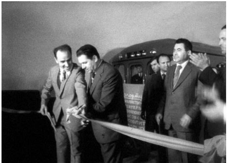
Перший секретар Харківського обкому КПУ І. З. Соколов перерізує стрічку на урочистому мітингу, присвяченому введенню в дію першої черги Харківського метрополітену. м. Харків, 1975 р.