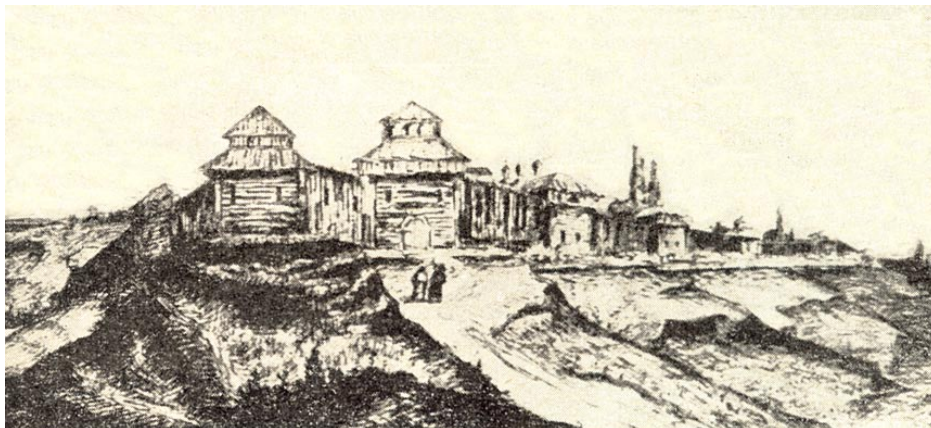
Загальний вигляд Полтавської фортеці в XVII ст. Малюнок невідомого автора

на котором расположена крепость, может быть много русских, спрятавшихся в покинутых домах. Король приказал генерал-адъютанту прислать к холму 60 солдат и ночью сжечь все дома возле подножья крепости. Позднее прибыли Реншильд и Левенгаупт и я доложил им о замеченных всадниках. После сумерек меня и моих людей сменил лейтенант Маннерберг, таким образом, я пробыл на дежурстве полтора дня. После смены я увидел полковника Сигрута с 50 кавалеристами, которые направлялись к подножью холма. С ними были капитан, лейтенант и корнет. Кавалеристы должны были сменяться каждый вечер. В этот же день прибыло еще несколько полков. Это была колонна генерал-майора Спарре, с которой прибыло 4000 запорожцев, которые недавно стали нашими союзниками. Дивизия Спарре разместилась возле города, а часть ее разместилась возле леса на север от Полтавы. Вишни начали краснеть, и я их попробовал в последний день апреля.