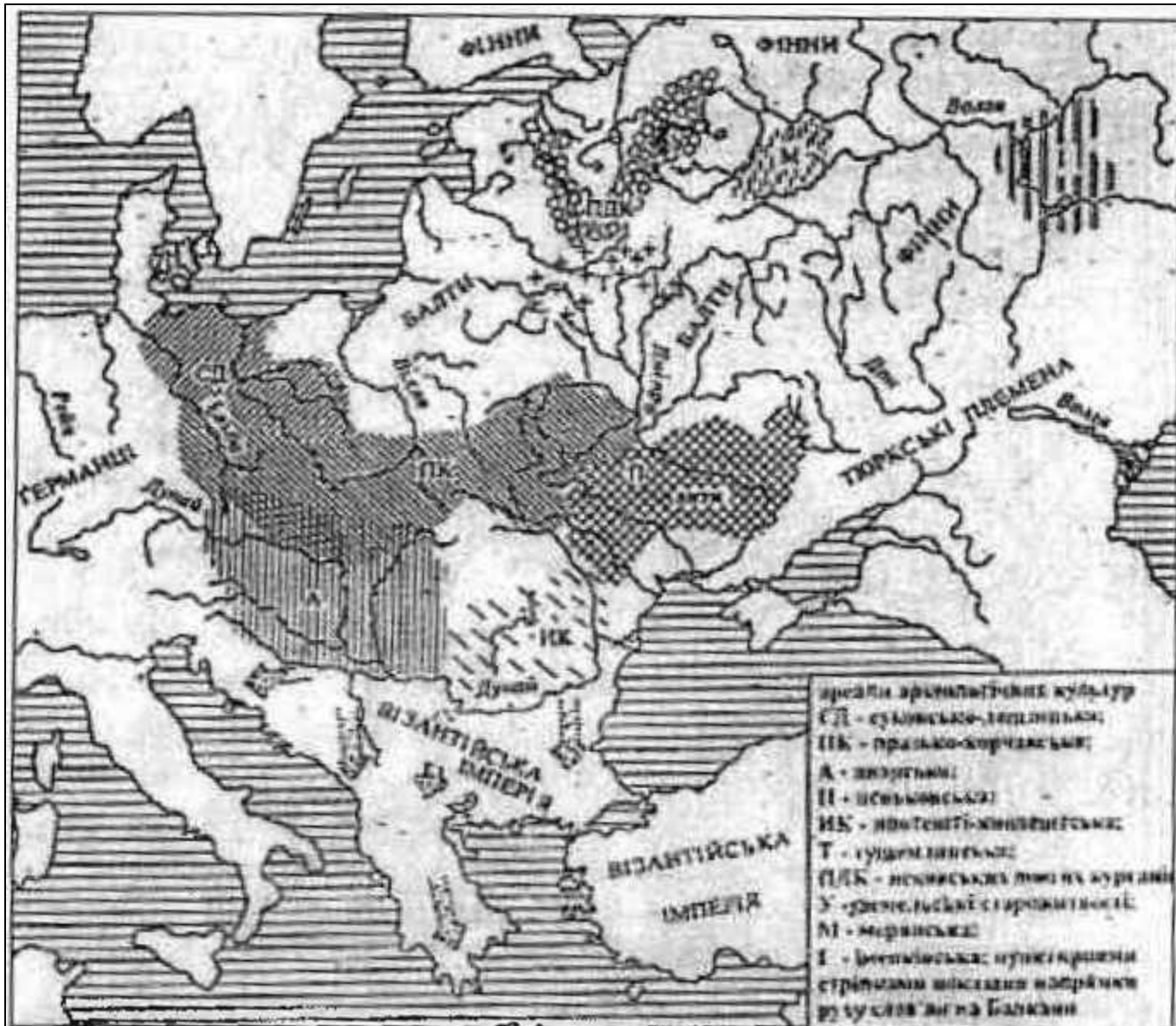
Рис. 4. Розселення слов'ян на початку середньовіччя (V—VII ст.)