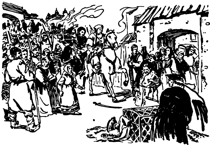
В'їзд козацького загону під проводом С. Наливайка в м. Могильов 1595 р.

Треба нагадати, що в той же час на Київському Поліссі діяли загони повстанців під проводом М. Шаули, Ф. Полоуса і Панчохи. Вони перебували в лісах на пра-