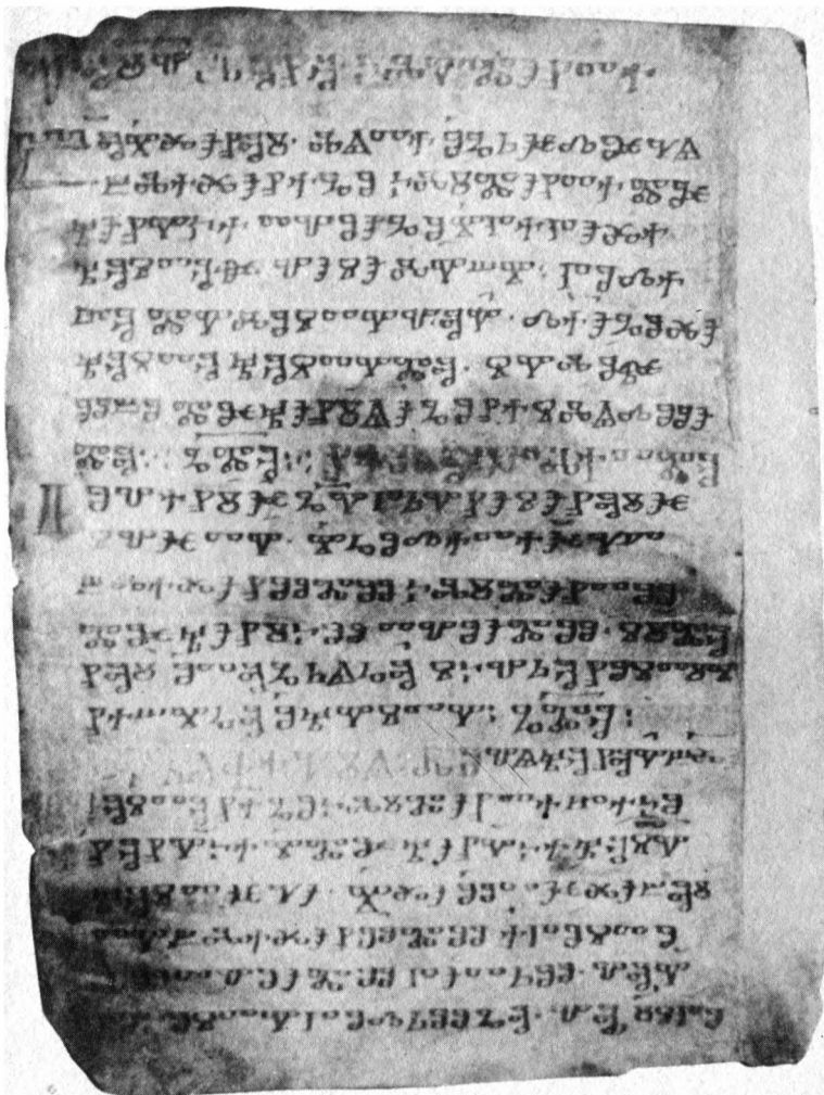
Сторінка 1 зв. Київських глаголичних листків в ультрафіолетовому промінні.