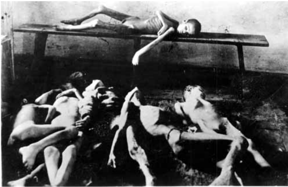
8. Трупы дітей, померлих від голоду, зложені в моргу.