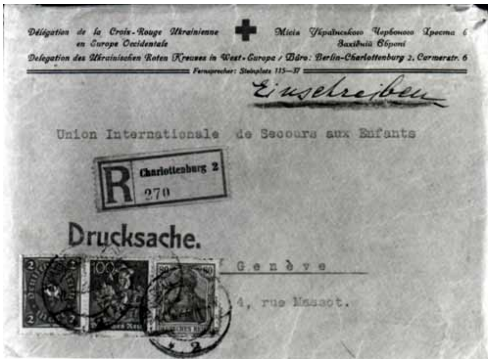
18. Конверта в якій Український Червоний Хрест переслав серію 17 фотографій до Міжнародного Союзу Допомоги Дітям в Женеві.