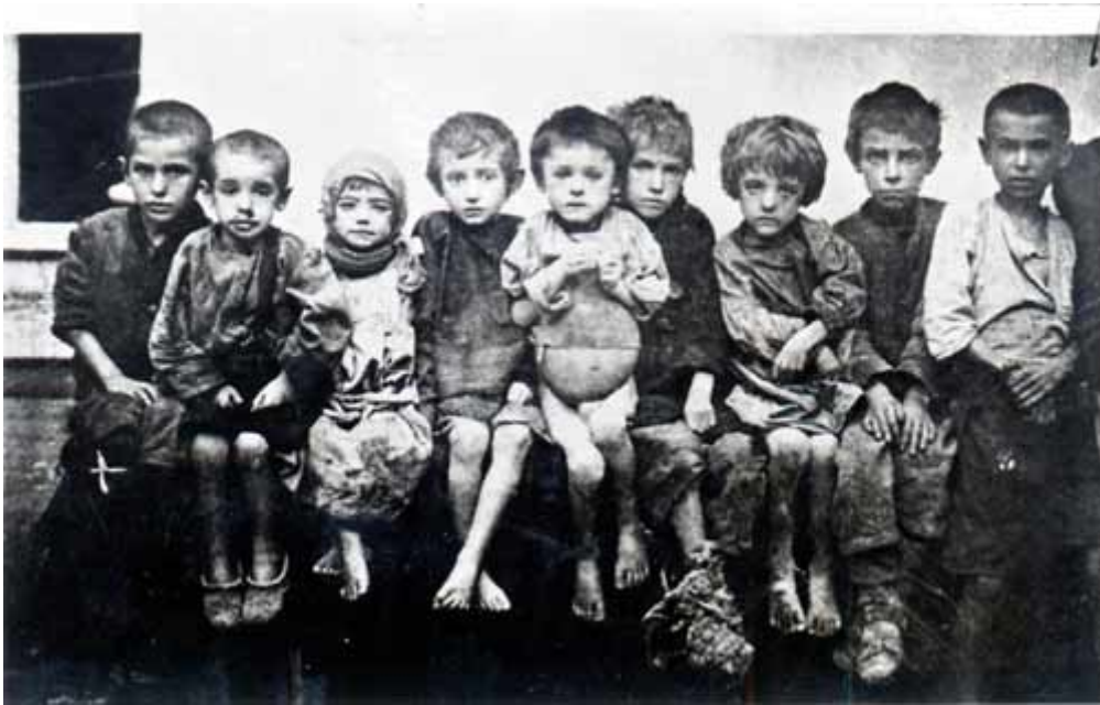
14. Діти опухлі від голоду (Гуляй Поле).