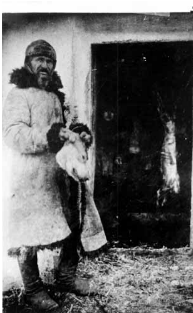
5. Розбирання собачої туші для людського споживання (повіт Гуляй Поле).