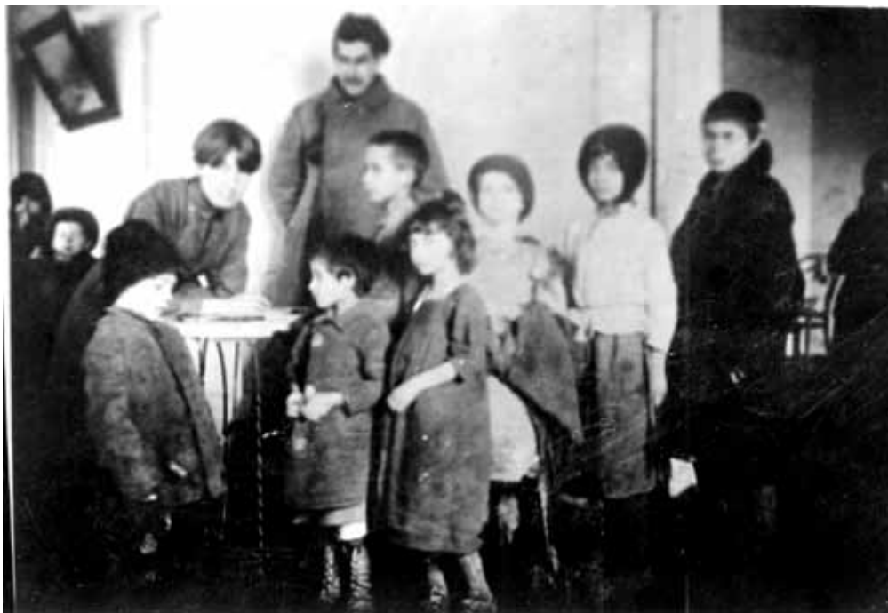
2. Записування дітей до їдальні (місто Олександрівськ).