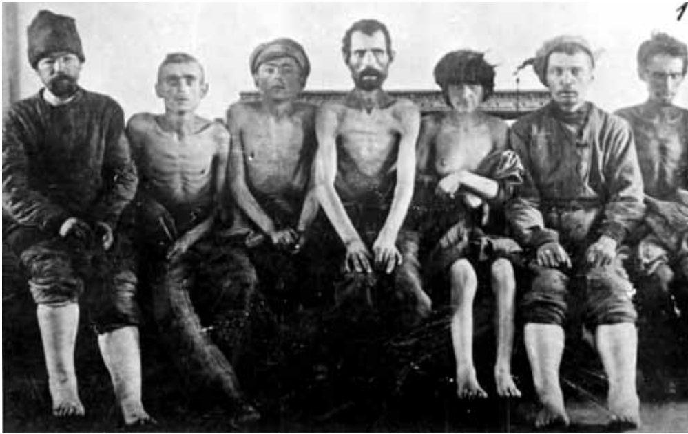
12. Доросле населення, опухле від голоду (Бердянськ).