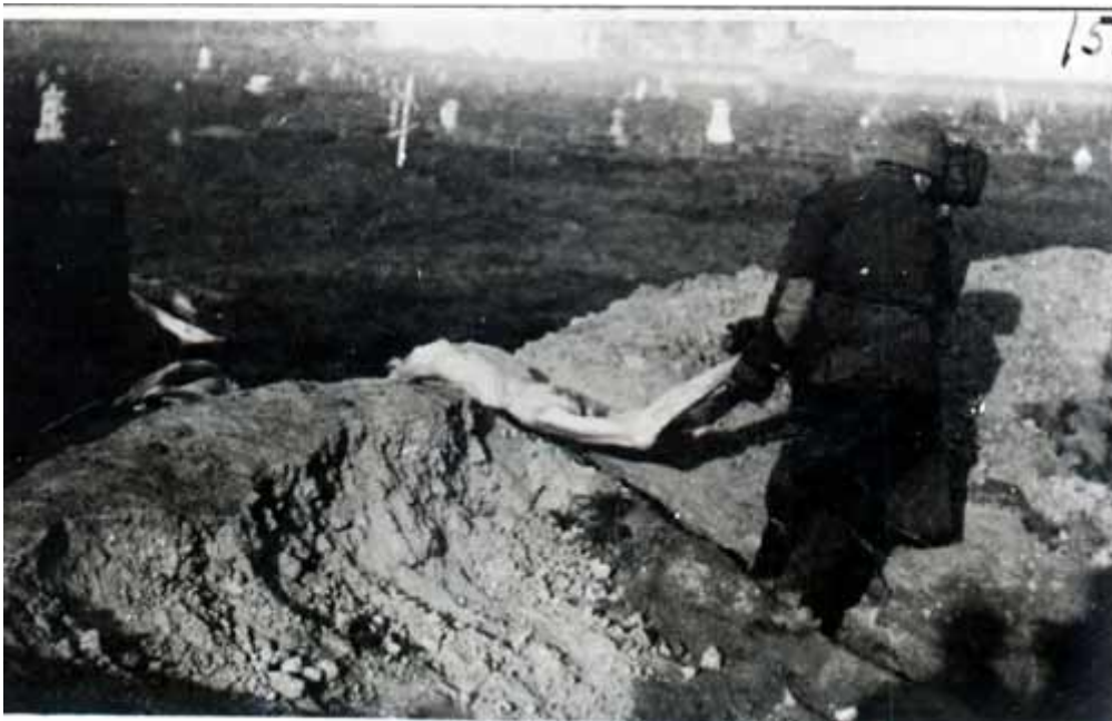
15. Похорон в Херсоні.