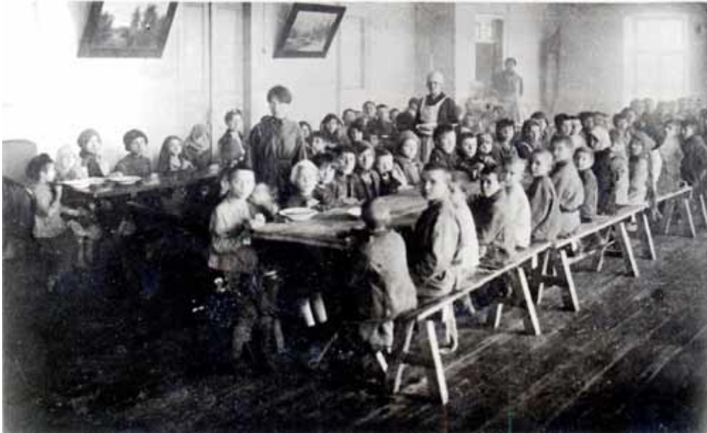
1. Їдальня для голодуючих дітей (місто Катеринослав).