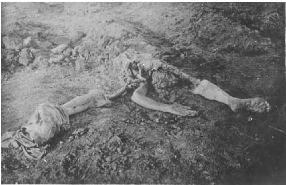
11. Труп померлого від голоду на вулиці Херсону.

Трупи були позбирані на вулицях міста Херсону.