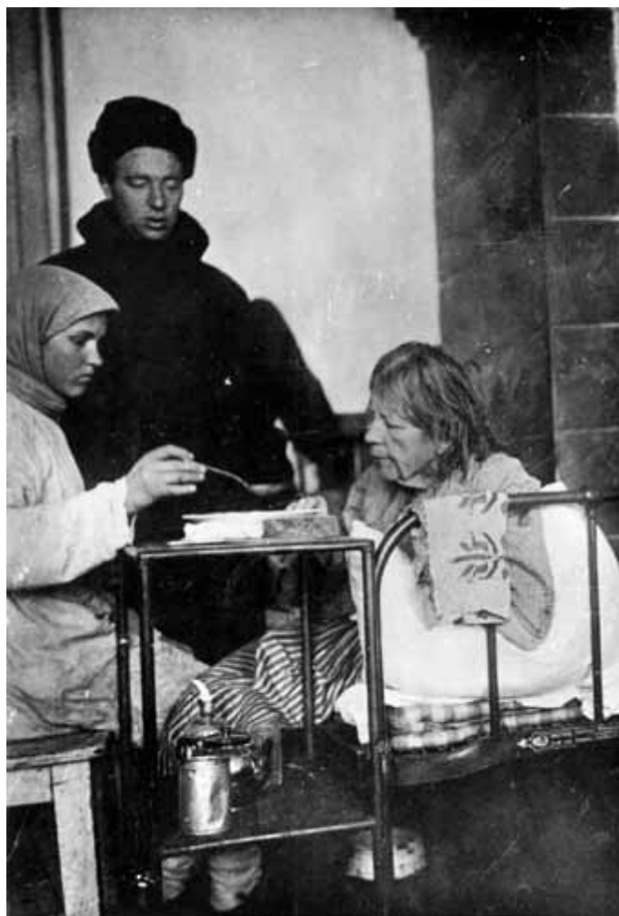
6. Учителька села Березівки, з 35 річним стажем служби, у сільській лікарні, хвора на набряки викликані голодом (повіт Гуляй Поле).