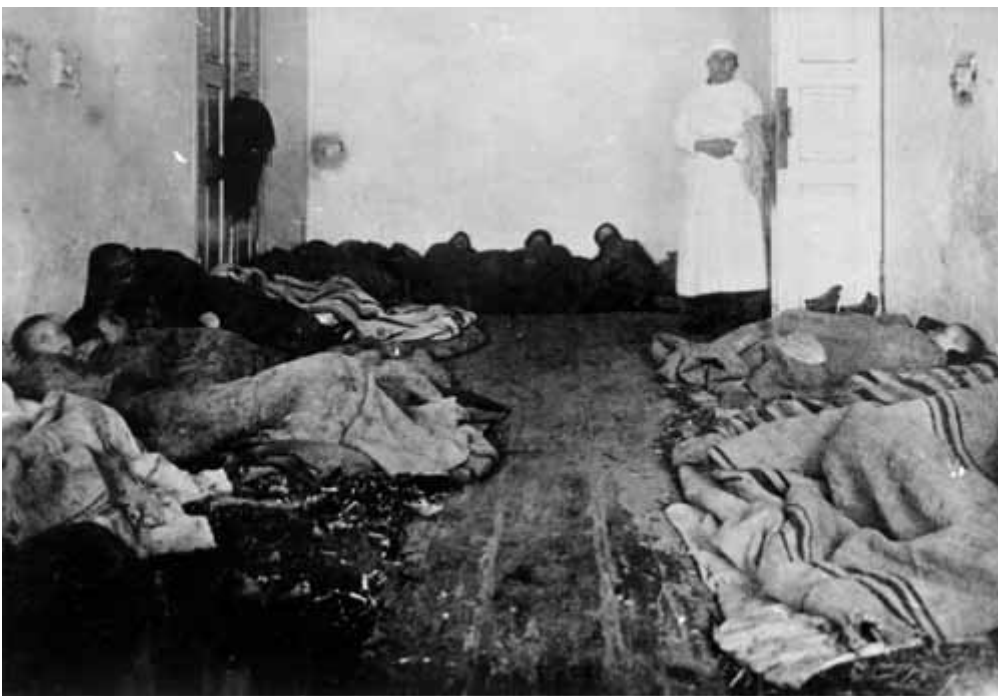
4. Хворі діти в сільській лікарні голодуючого села (повіт Гуляй Поле).