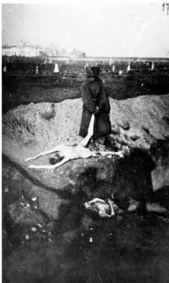
17. Похорон в Херсоні.