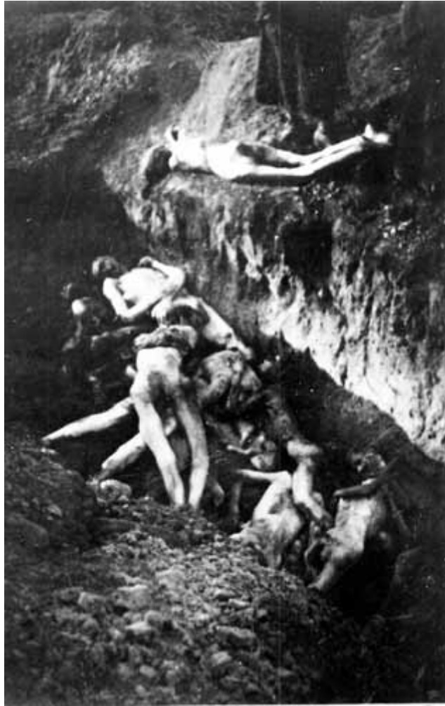
16. Похорон в Херсоні.