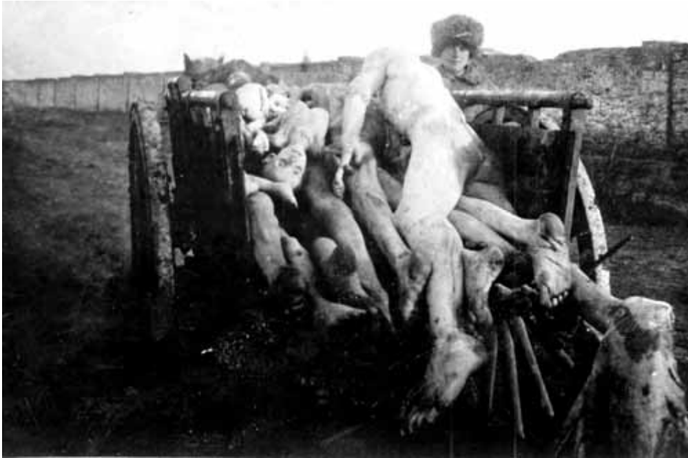
10. Перевіз на цвинтар трупів померлих від голоду.

Трупи були позбирані на вулицях міста Херсону.