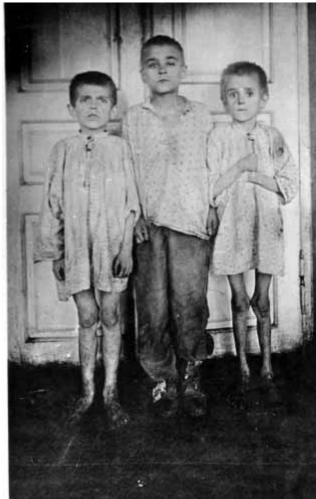
9. Діти доведені голодом до злочинства; хлопець зправа убив восьмирічного товариша і забрав у нього 4 фунти хліба (місто Катеринослав).