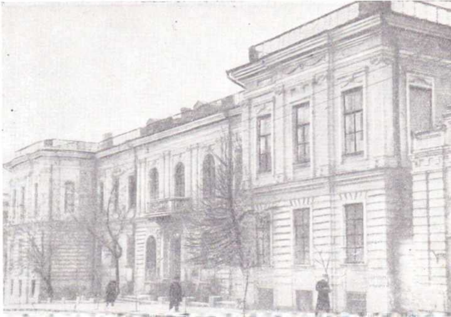
Головний корпус Харківського Державного університету. Архітектурне спорудження другої половини XVIII ст

для церковних потреб. Ще у 80-х роках XVII ст. російські і українські майстри збудували в Харкові Покровську церкву; ця будівля існує й понині і являє собою цікавий пам'ятник російсько-українського зодчества XVII ст.