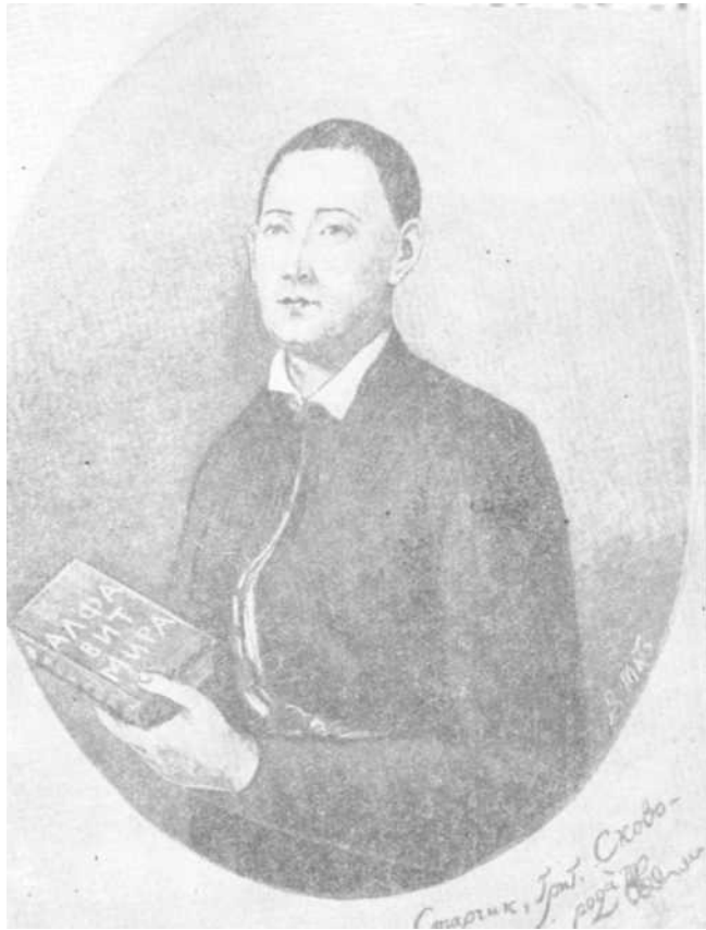
Г. С. Сковорода.

Сковорода завжди знаходив про що сердечно поговорити з людьми і всіх приваблював своїми бесідами. Особливо любив бути серед селян та міських трудівників. Всюди він проповідував свої погляди, особливу увагу звертаючи на необхідність ширити освіту в народі. Помер Г. С. Сковорода 9 листопада 1794 р. в селі Іванівці (тепер Сковородинівка) під Харковом. На надгробному памятнику, за проханням Сковороди, начертана епітафія: «Мир ловил меня, но не поймал». Ці слова означають, що світ кріпосників і церковників не спіймав Сковороди в свої тенета—він залишився народним поетом і філософом.