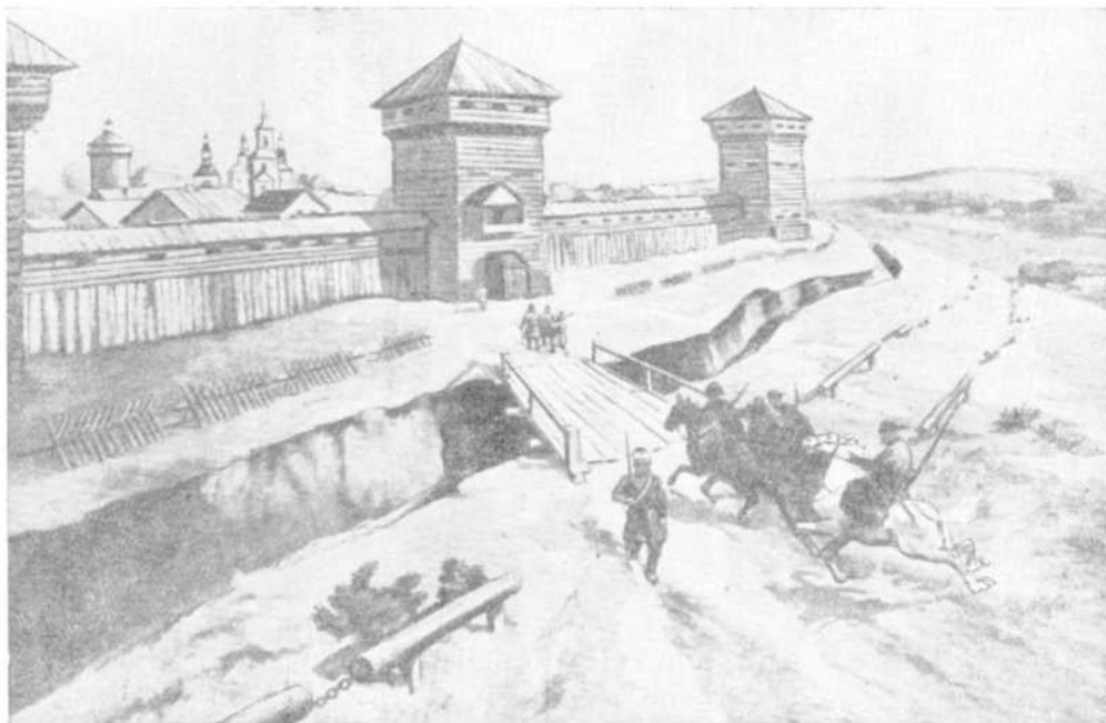
Харківська кріпость XVII ст. З картини академіка М. С. Самохіна.

Харків мав приміське укріплення на Ржевому колодязі, на Муравському шляху. Це спорудження складалося з будівлі, огороженої частоколом 80 сажнів довжиною та 2 сажні висотою. Біля цього острожка була засіка 200 сажнів довжиною та 50 сажнів шириною. В самому острожку знаходилась башта для вартових. Харківська залога, яка складалася в основному з українців і певного числа росіян, несла сторожову службу в