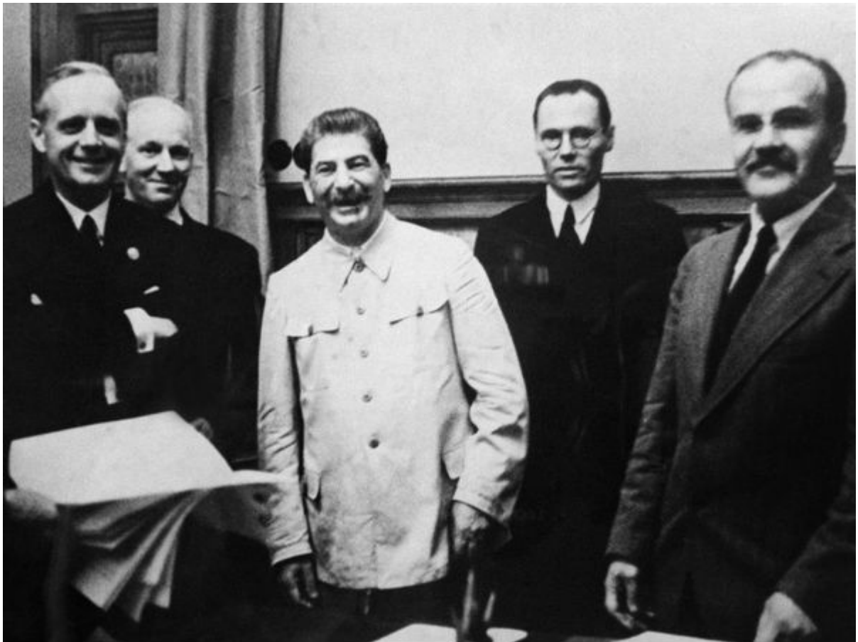
Після підписання пакту про ненапад. Ліворуч - Ріббентроп, праворуч - Молотов

Упевнений в успішності місії Ріббентропа фюрер, виступаючи на нараді вищого військового керівництва у Оберзальцбері, наголосив: