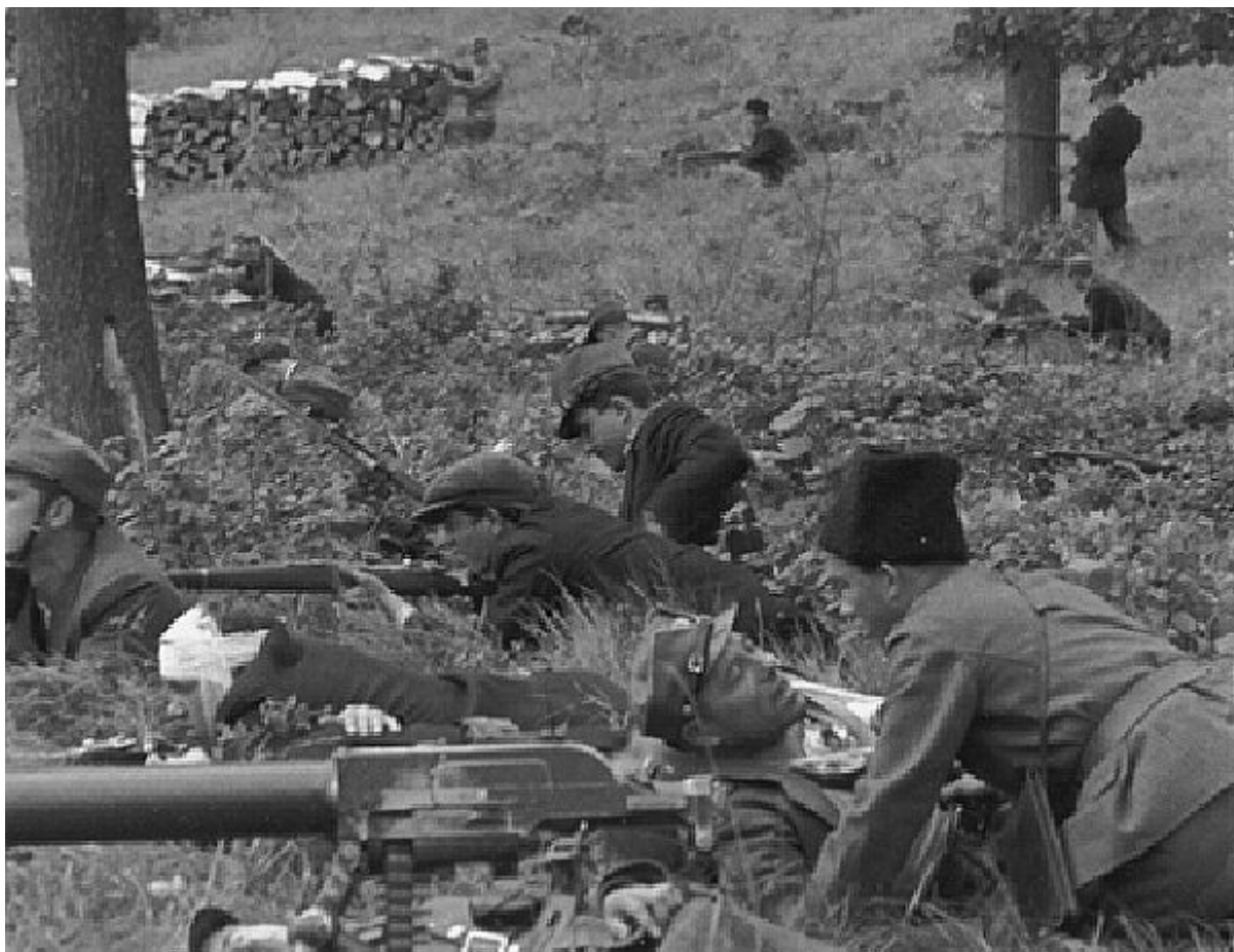
Солдати армії Карпатської України. Більше фото дивіться в розділі "Артефакти"

Президент Карпатської України Августин Волошин відкинув німецький ультиматум . Героїчний спротив Української Карпатської Республіки був потоплений у крові угорськими гонведами, "українська проблема" черговий раз була принесена в жертву геополітичним інтересам могутніх європейських гравців.