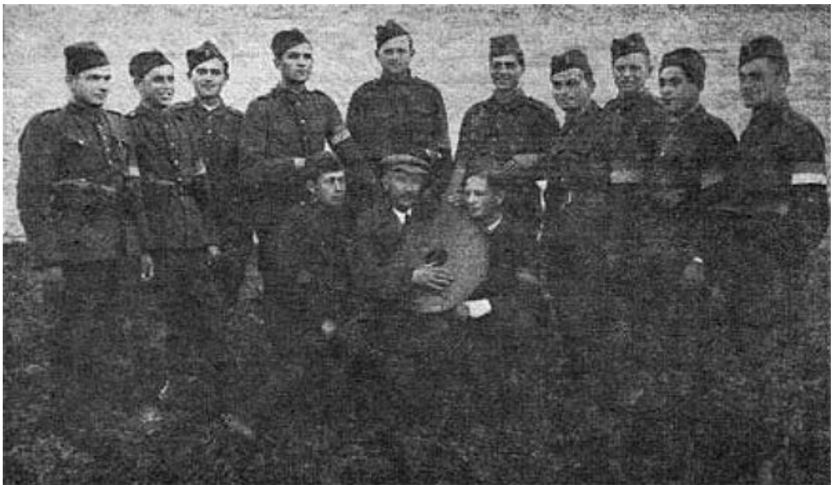
Солдати "легіону Сушка" в Коросні [нині Польща], 1939 рік.

Український Легіон із 200 (за деякими даними із 600) осіб очолив полковник Роман Сушко, його формування стало важливим чинником тиску на Кремль для німецької дипломатії.