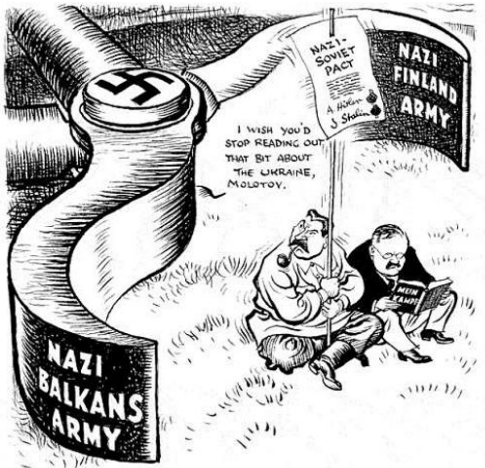
Карикатура з британської Daily Mail (1 травня 1941 року). Сталін каже Молотову, котрий сидить із книгою Гітлера : "Годі вже читати той шматок про Україну".

Основним способом досягнення мети Німеччина обрала дестабілізацію внутрішньої ситуації у країнах, що мали бути підкорені в майбутньому.