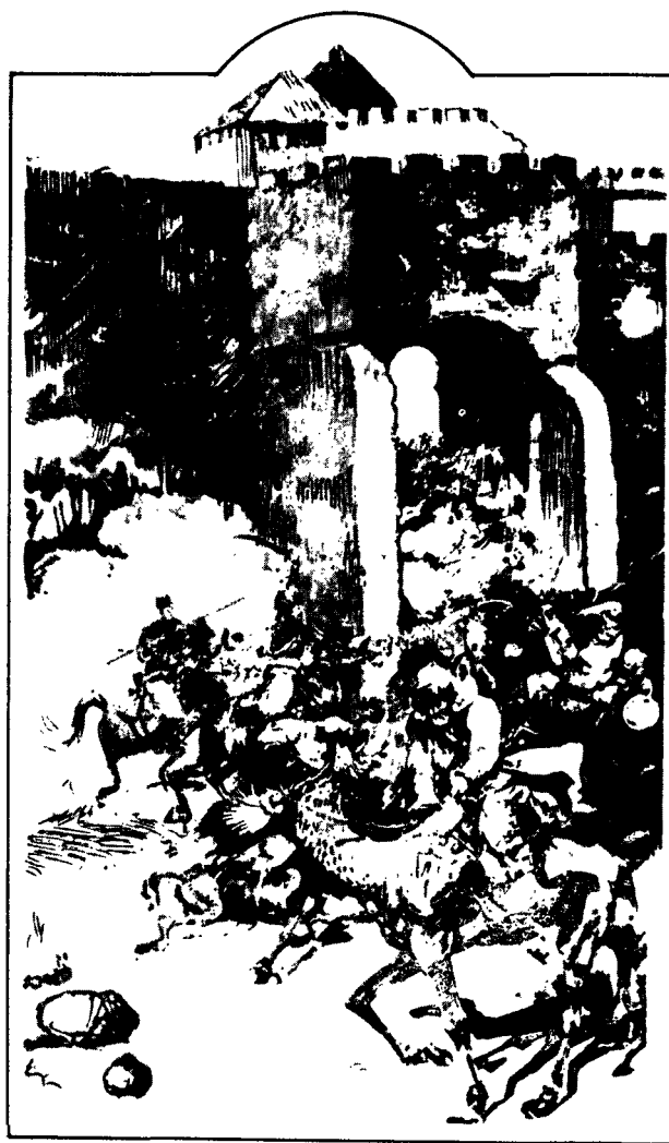
Фрагмент з малюнка М. Сидоренка