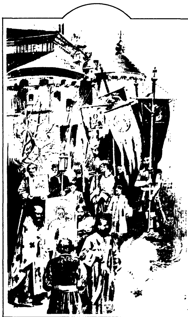
Фрагмент з малюнка М. Самокиша